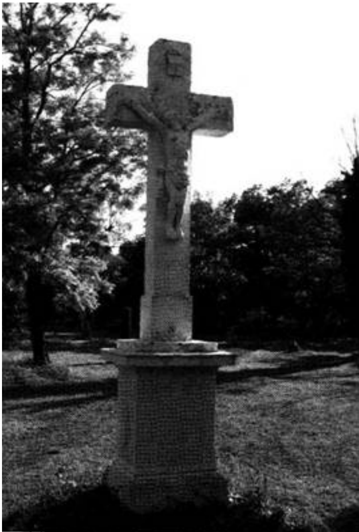
A kereszt a régi Dioskerti templom (a CBA arunáz mellett).

2014. október 27. hétfő, 13:12 - Módosítás: 2016. április 16. szombat, 14:37